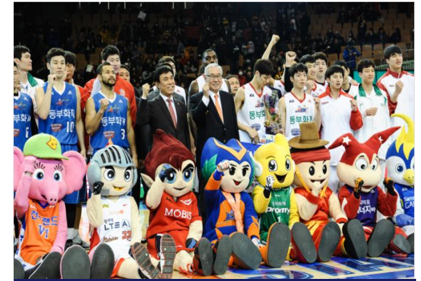
2014-2015 KCC 프로농구 올스타전

장 소 인천 삼산월드체육관 대 상 대한민국 국가대표팀 리투아니아 국가대표팀 체코 국가대표팀 앙골라 국가대표팀 주 최 / 주 관 현대모비스