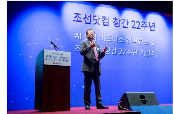
조선닷컴 창간 22주년 AI 산업 비즈니스 컨퍼런스