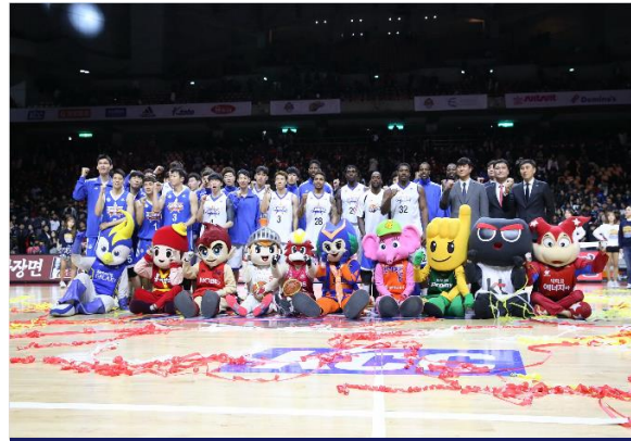
2016-2017 KCC 프로농구 올스타전