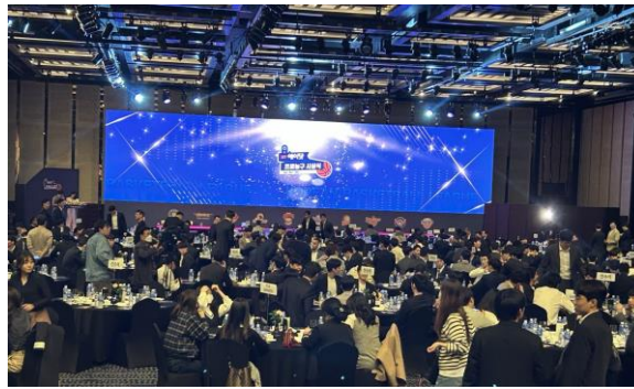
2022-2023 KBL 시상식