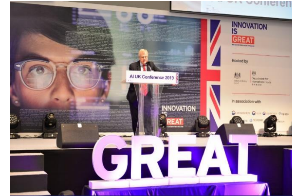
AI UK Conference

장 소 서울 신라호텔 다이너스티홀 대 상 정·재계 관계자 / 학계 / 각 기업 및 단체 1200명 주 최 / 주 관 한국일보 / THE KOREA TIMES 주 요 내 빈 국회의장 및 각 당대표 토마스 사전트 뉴욕대 교수 윤종원 대통령비서실 경제 수석 김대환 前 노동부장관