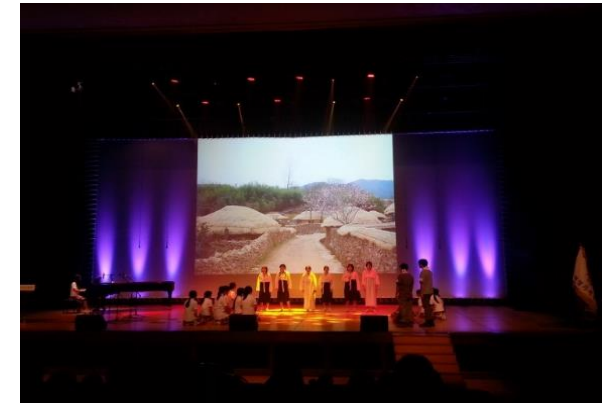
일본군위안부 평화나눔 콘서트

일시 2015년 5월 장소 서울랜드 삼천리극장 대상 노루그룹 임직원 및 가족 6,000명 주최/주관 노루그룹