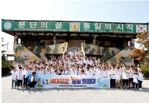
세대공감 통일 원정대

정부 · 지자체 · 공공기관 · 기업 및 단체 등 다양한 클라이언트의 입장에서 행사를 기획하고 각 분야별 우수 경력 직원으로 구성된 TF팀을 운영하여 [맞춤형 기획 & 고객만족 행사]를 추구합니다.