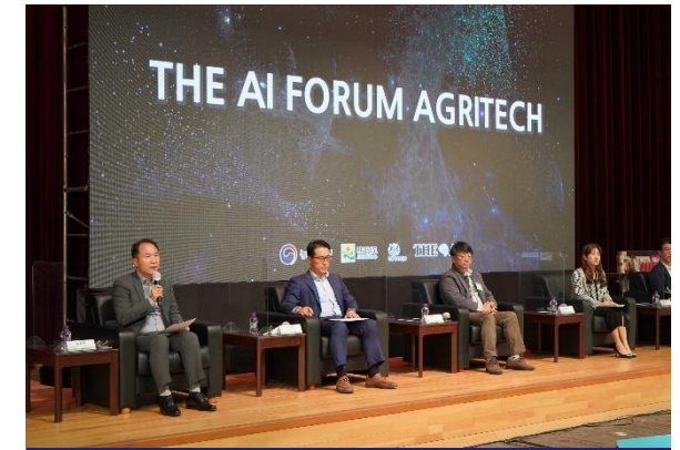
The AI FORUM : AGRITECH

장 소 서울 상암동 누리꿈스퀘어 주 최 / 주 관 정보통신산업진흥원 THE AI 디지털조선일보 주 요 내 빈 김창용 정보통신산업진흥원장 안철수 국민의당 대표 김영식 국회의원 서정숙 국회의원