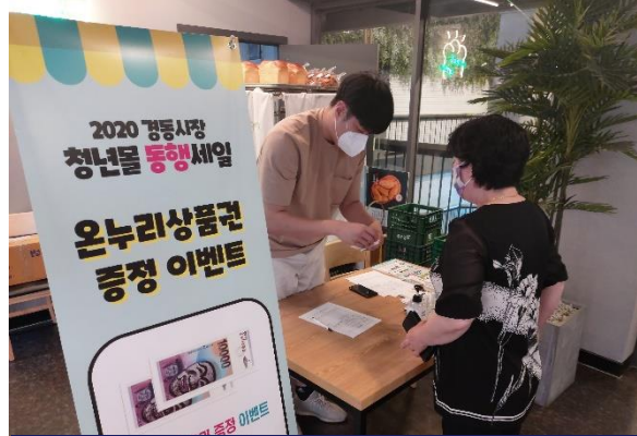
2020 청춘시장 동행세일 (동대문 경동시장 청년물)

일 시 | 2019년 10월 장 소 | 강학 교동도 주최 / 주관 | 관악구청