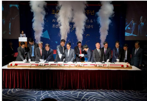
조선닷컴 창간22주년 기념식

정부 · 지자체 · 공공기관 · 기업 및 단체 등 다양한 클라이언트의 입장에서 행사를 기획하고 각 분야별 우수 경력 직원으로 구성된 TF팀을 운영하여 [맞춤형 기획 & 고객만족 행사]를 추구합니다.