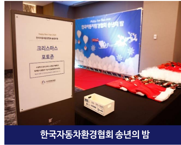
한국자동차환경협회 송년의 밤

일 시 2019년 11월 장 소 대전 선샤인 호텔 - 5층 그랜드볼룸 주 최 / 주 관 농림축산식품부 주 요 내 빈 농림축산식품부 임직원 한국농어촌공사 임직원