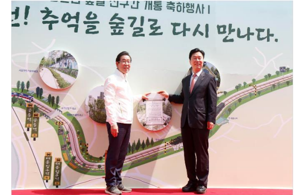
경춘선 숲길 전구간 개통 축하행사

일 시 2017년 9월 장 소 서울 웨스틴 조선호텔 그랜드 볼룸 주최/주관 디지털조선일보 주요내빈