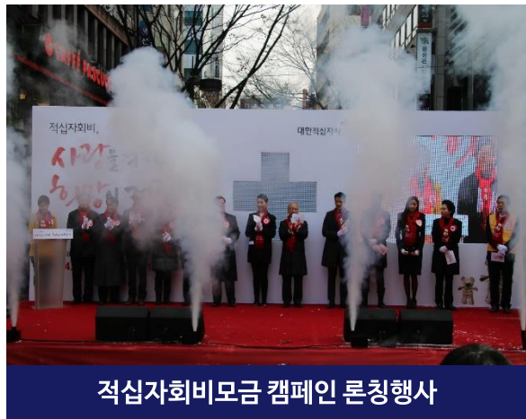
적십자회비모금 캠페인 론칭행사

정부 · 지자체 · 공공기관 · 기업 및 단체 등 다양한 클라이언트의 입장에서 행사를 기획하고 각 분야별 우수 경력 직원으로 구성된 TF팀을 운영하여 [맞춤형 기획 & 고객만족 행사]를 추구합니다.