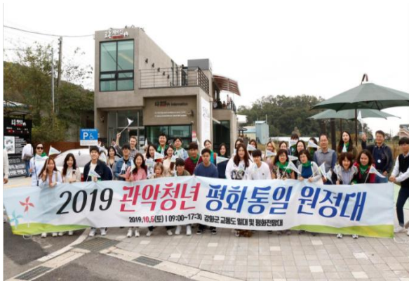
관악청년 평화통일 원정대

정부 · 지자체 · 공공기관 · 기업 및 단체 등 다양한 클라이언트의 입장에서 행사를 기획하고 각 분야별 우수 경력 직원으로 구성된 TF팀을 운영하여 [맞춤형 기획 & 고객만족 행사]를 추구합니다.