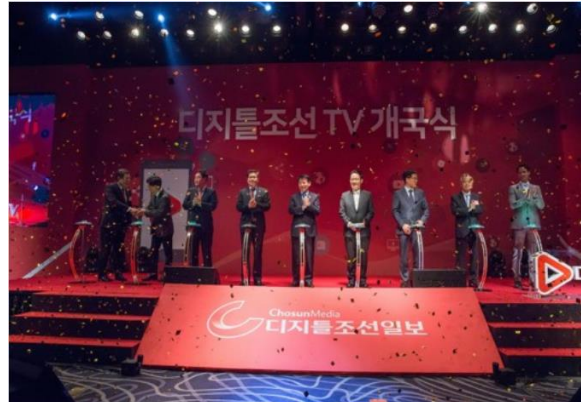
디지털조선 TV 개국식