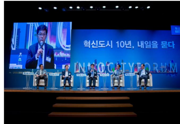
국가균형발전을 위한 혁신도시포럼