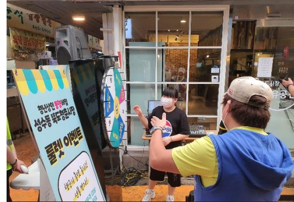
2020 청춘시장 동행세일 (성수동 뚝도시장)

일 시 | 2020년 7월 장 소 | 경동시장 청년물 주최 / 주관 | 소상공인시장진흥공단