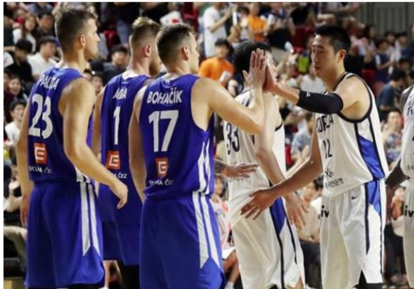
현대모비스 초청 4개국 국제농구대회

대한민국 주요 프로스포츠 및 생활체육 활성화에 기여하기 위한 효율적인 이벤트 운영 대행 / 팬과 함께하는 새로운 응원 문화의 패러다임 창출과 더불어 스포츠마케팅(스폰서십) 업무를 확장하여 광고주의 필요 충분조건에 맞는 대행사로 성장해 나가고 있습니다.