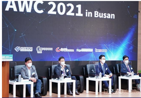
AWC2021 in Busan (AI World Congress)

장 소 벅스코 컨벤션홀 관 람 객 30,000명 이상 주 최 / 주 관 한국일보/부산광역시 주 요 내 빈 한덕수 국무총리 박형준 부산시장