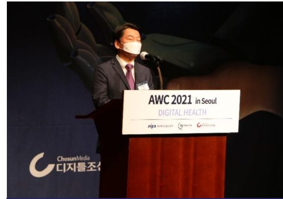
AWC2021 in Seoul (AI World Congress)

장 소 부산벅스코 제2전시장 AWC 홀 하이브리드(온라인 웨비나 병행) 진행 주 최 / 주 관 부산광역시 THE AI 디지털조선일보 부산정보산업진흥원 BEXCO 주 요 내 빈 김창용 정보통신산업진흥원 원장