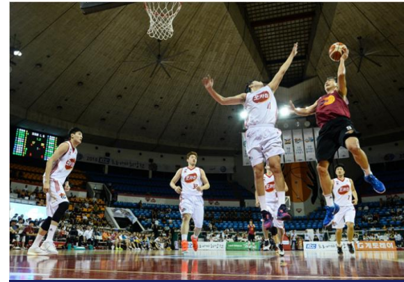
KCC 프로-아마 최강전