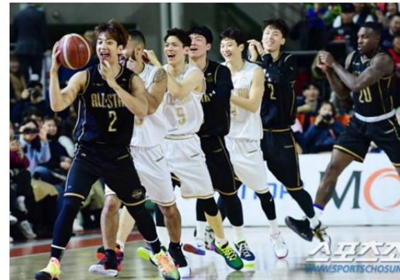
2019-2020 현대모비스 프로농구 올스타전