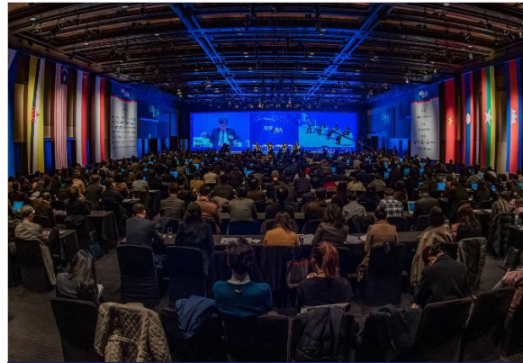
THE KOR-ASIA FORUM