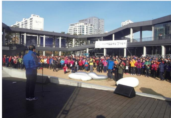
서울 둘레길 걷기축제

일시 2014년 10월 장소 남산 국립극장 광장 대상 서울시민대상 약 1,000명 주최/주관 해양수산부 / 한국일보 주요내빈 이주영 명예대회장 박재영 해양수산부장관 이준희 한국일보사 사장