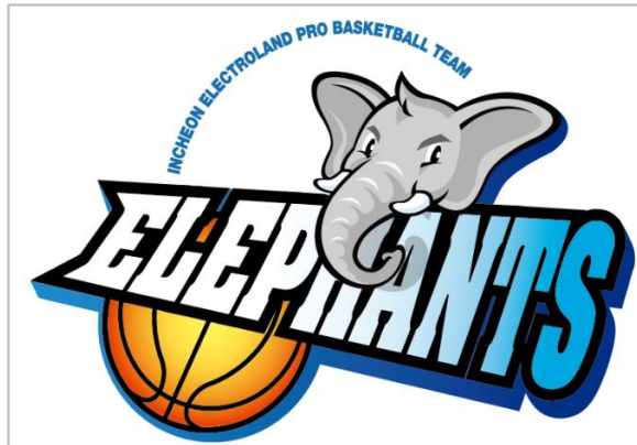
인천 전자랜드 엘리펀츠 프로농구단 시즌 운영