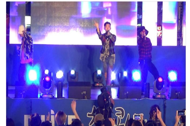
압구정로데오거리 문화명소 콘서트

일 시 | 2017년 4월 장 소 | 여의도 한강공원 특설무대 주최/주관 | 미래창조과학부 / 한국과학창의재단