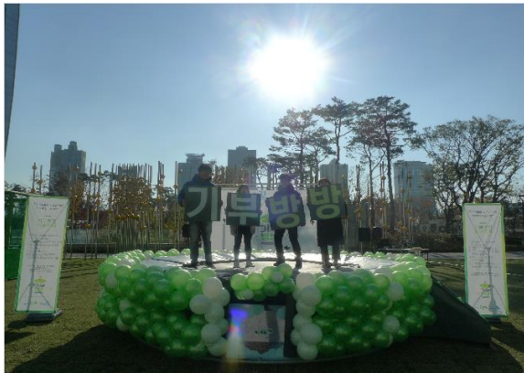
희망TV SBS 20주년 기념 기부방방 이벤트

일 시 2017년 9월 2018년 9월 장 소 임진각 일대 / 평화누리공원 주최 / 주관 동작구청