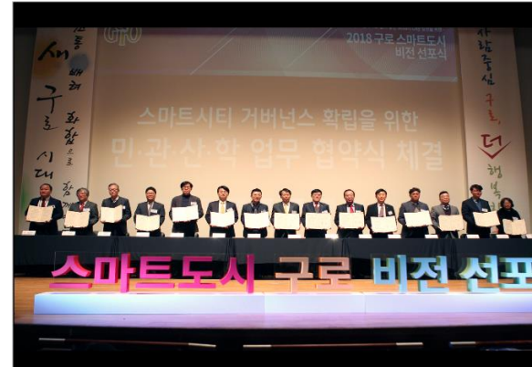
구로 스마트도시 비전 선포식