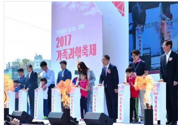
‘한강에서 즐기는 과학’ 가족과학축제

일 시 | 2016년 6월 | 2017년 6월 장 소 | 지산 포레스트 리조트 메이플콘도 주최/주관 | 전자랜드 프라이스킹