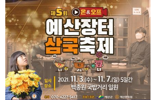
제 5회 예산장터 삼국축제

일 시 | 2020년 7월 장 소 | 뚝도시장 內 주최 / 주관 | 소상공인시장진흥공단